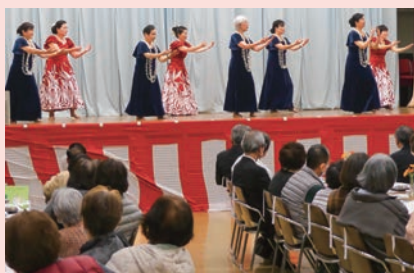
フラダンス「リリレファ大島」の皆さん

1月19日、大島農村勤労福祉センターで、「ひとり暮らしの高齢者の集い」を開催。 主に大島町内の75歳以上のひとり暮らしの高齢者が参加、来賓を合わせると総勢64人が集まりました。 また、大島こども園の園児による歌と踊り、「リリレファ大島」によるフラダンスなどで、会場は大いに沸きました。