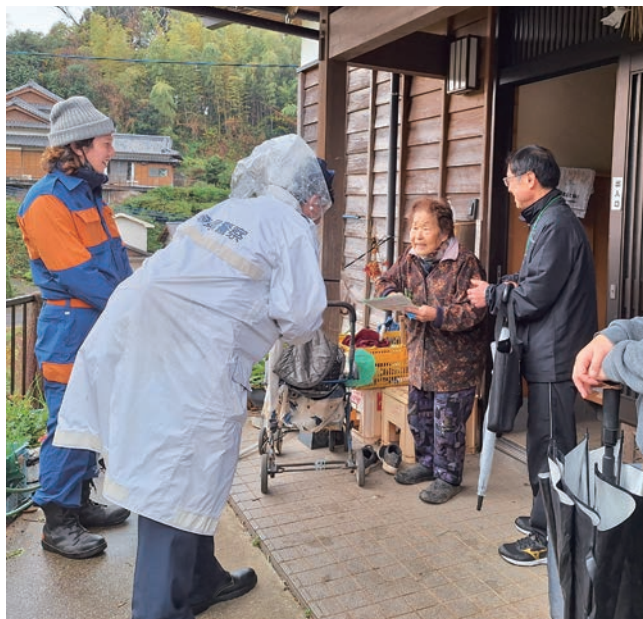
お互いに顔の見える関係でほんと安心

12月24日、西海町中浦地区で、ひとり暮らしの高齢者世帯約30世帯に訪問活動を行いました。 行政區長や民生委員・児童委員、福祉推進員、消防団員、西海警察署員や社協職員など、約20人が参加。