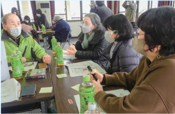
お互いの活動の情報交換