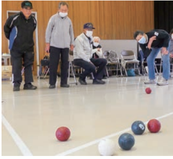
白いボールを目がけて