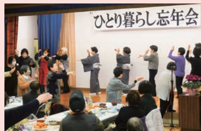
最後は「西海音頭」を踊りました

1月19日、大島農村勤労福祉センターで、「ひとり暮らしの高齢者の集い」を開催。 主に大島町内の75歳以上のひとり暮らしの高齢者が参加、来賓を合わせると総勢64人が集まりました。 また、大島こども園の園児による歌と踊り、「リリレファ大島」によるフラダンスなどで、会場は大いに沸きました。