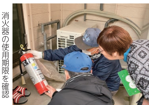
消火器の使用期限を確認

訪問時には「火事に気を付けて、良いお年をー」や「二七電話詐欺には気をつけてください」、「何かあればいつでも連絡してね」などの地域の方からの声かけに、「皆さん来てくれてありがとう」と温かいやりとりが見られました。